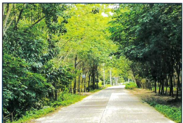
ภาพระหว่างดำเนินงาน