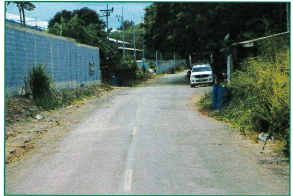
ภาพก่อนดำเนินงาน