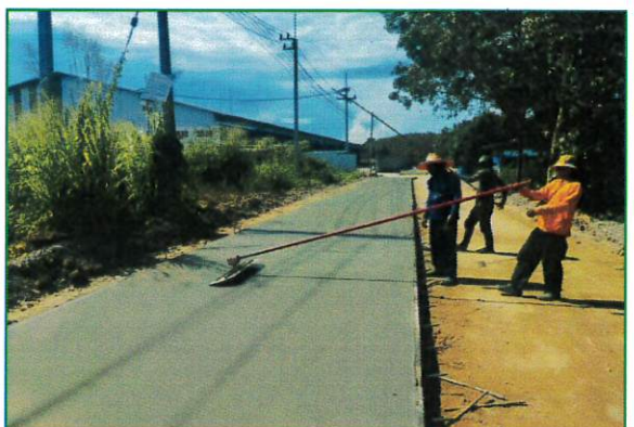
ภาพระหว่างดำเนินงาน