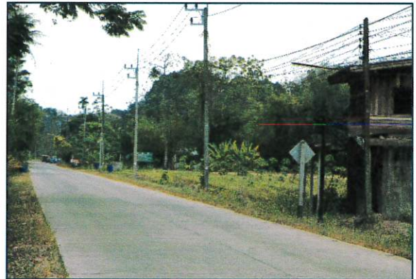
ภาพก่อนดำเนินงาน