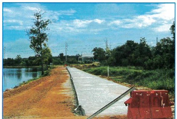
ภาพระหว่างดำเนินงาน