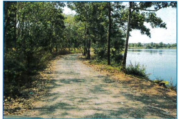
ภาพก่อนดำเนินงาน